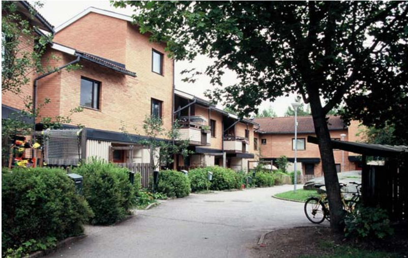
TREVÅNINGSDELAR växlar här med tvåvåningshus, alla i röd-aktigt tegel.

Ingen möda har sparats för att åstadkomma den eftertraktade småskaligheten och omväxlingen, i synnerhet mot gårdarna. Husens form, material och färg varierar ständigt, till synes outtömligt. I själva verket är det ett antal typiserade enheter som satts samman i olika kombinationer. Varje gård har fått sin egen färg på teglet, för att förstärka dess egenart.