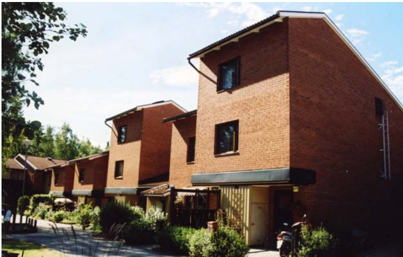
HÄR SKILJS TVÅ tvåvåningsdelar av tegel av en låg indragen del, klädd med träpanel. Det utskjutande förrådet kompletteras ofta med små skärmtak över ingångarna.