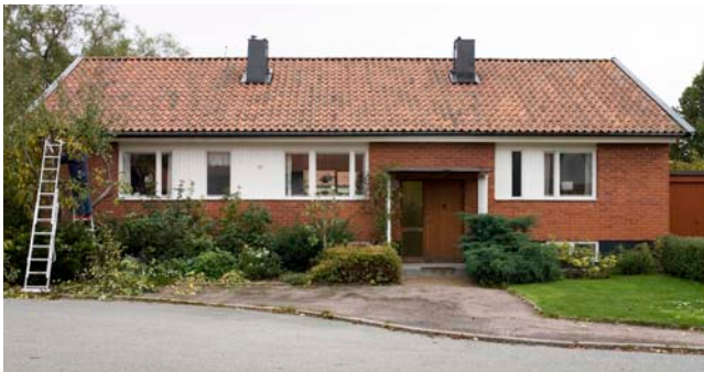
DEN LÅGA, VILANDE karaktären hos dessa hus förstärks av att fönstren genom den vita träpanelen sammanfattats i långa band. En tunn takskiva på smala metallstöttor betongar och skyddar den enkla ingången.