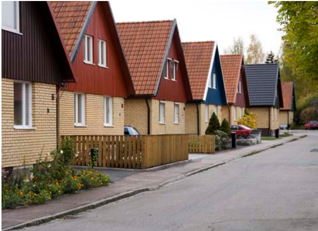
DEN ENA HUSTYPEN i söder ger med sina höga gavlar och branta tak en snabbare rytm åt gaturummet. Ingångarna är indragna mellan husen.

I söder finns bara två hustyper, båda med fasader av tegel och trä. Den ena är lång och låg, har fasader av rött tegel och vitmålat trä och flacka sadeltak, den andra är kortare, med väggar av gult tegel och gavelspetsar av trä under branta sadeltak. De förra husen vänder långsidorna mot gatan, de senare gavlarna och gaturummen blir mycket olika. Båda typerna ritades av Gösta Wikforss och byggdes av Anders Diös. Viktigt är att husen förändrats mycket lite, och i synnerhet de lägre husen bildar med sina välavvägda proportioner och det goda samspelet med landskapet ett mycket tilltalande småhusområde.